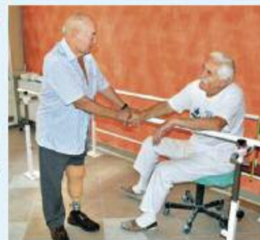
Ponad 350 zadowolonych pacjentów rocznie