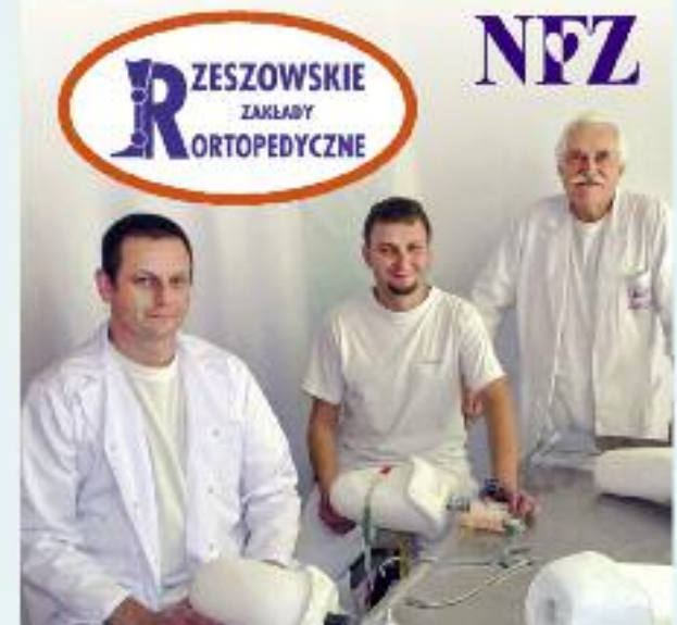
Ręczna obróbka gipsowego odlewu kikut

tel. 600 957 552 SPRAWDŹ, KIEDY JESTEŚMY W TWOIM MIEŚCIE