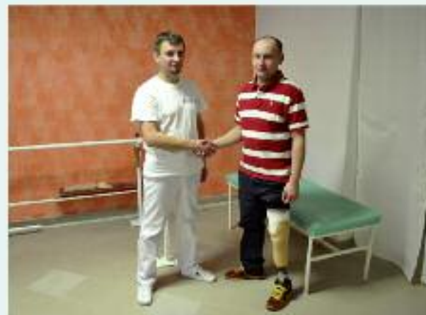
Ponad 350 zadowolonych pacjentów rocznie