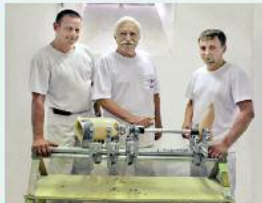
Precyzyjnie ustawiamy każdą protezę