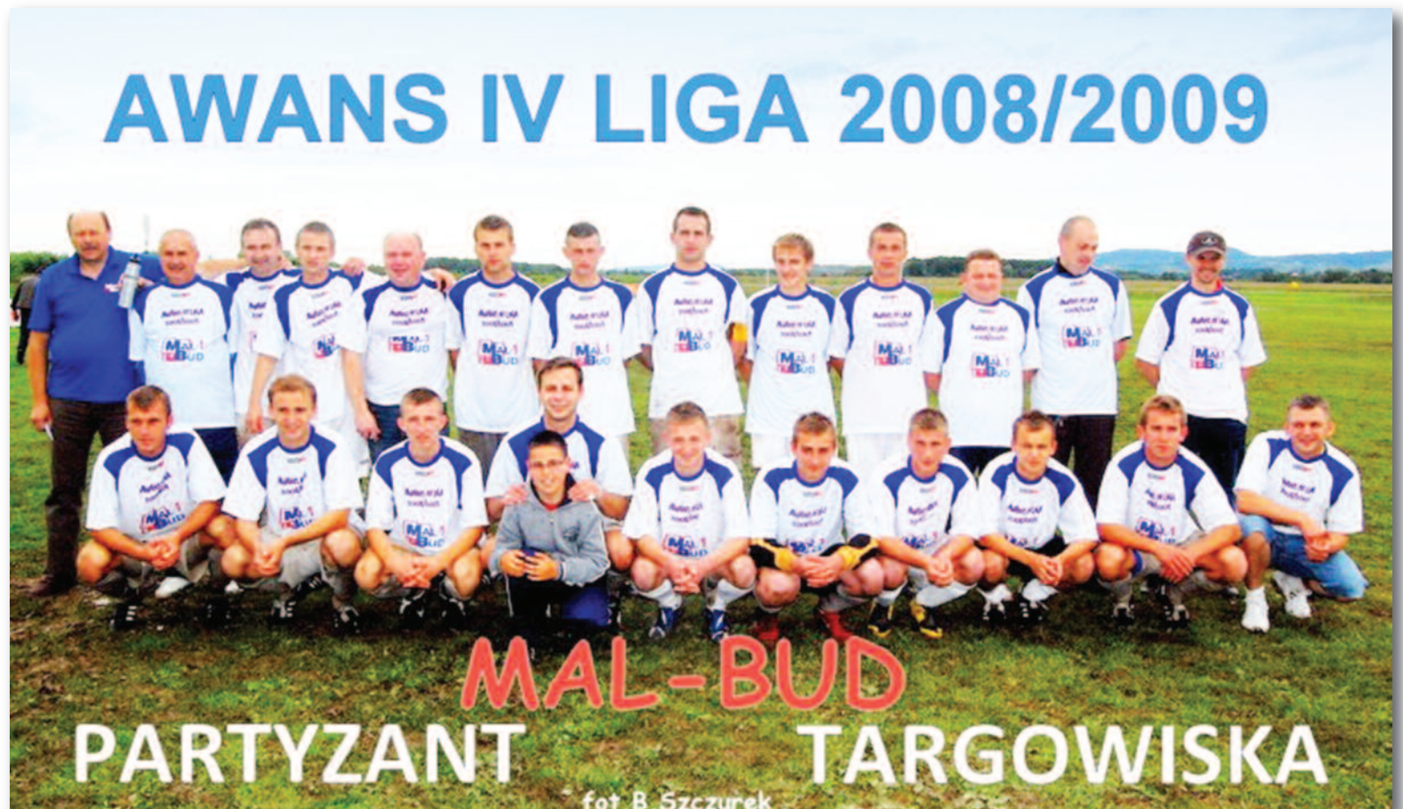
Drużyna, która wywalczyła historyczny awans „Partyzanta Mal-Bud-1” Targowiska do IV ligi.

Równoległe do prac dostosowawczych na obecnym stadionie podjęte zostały przez Gminę działania zmierzające do budowy nowego obiektu. Wykupiony został teren, opracowano dokumentację, przebudowana została linia elektroenergetyczna kolidująca ze stadionem, wykonany został duży zakres prac ziemnych, niezbędnych ze względu na ukształtowanie terenu. Mam nadzieję, że w najbliższych latach prace będą kontynuowane i znajdą szczęśliwy finał w postaci stadionu z prawdziwego zdarzenia, z wygodnym zapleczem w budynku, trybuną i zasilaniem z sieci, a nie ... z agregatu prądotwórczego.