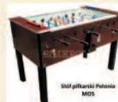
Stół piłkarski Polonia MOS