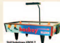
Stół hokejowy KROS 7