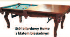
Stół bilardowy Home z blatem biesiadnym

Szczegóły na naszej stronie internetowej. Serdecznie zapraszamy. ul. Pużaka 57, 38-400 Krosno, tel. 13/4360008, kom. 606655979 www: www: www.billkros.com , e-mail: billkros@billkros.com