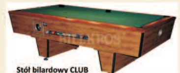
Stół bilardowy CLUB