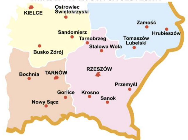
Mapka dojazdu w Rzeszowie