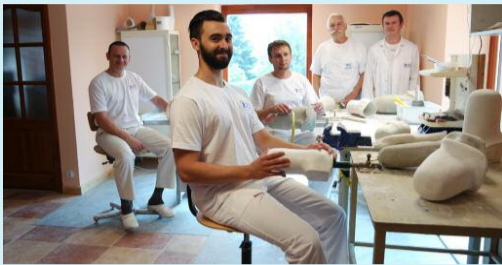
Ręczna obróbka odlewu gipsowego

Dla dobra wszystkich pacjentów, również tych, którzy wykonali protezę w innym zakładzie, to badanie wykonujemy bezpłatnie ( Laser Posture posiada zaledwie 6 zakładów w Polsce). Więcej informacji w „ABC DOBREJ PROTEZY”, które bezpłatnie do Państwa prześlemy.