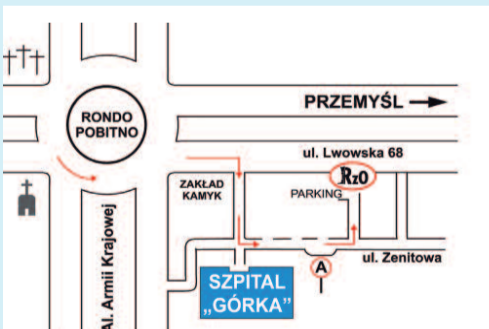
Mapka dojazdu w Rzeszowie

SIEDZIBA ZAKŁADU ZNAJDUJE SIĘ 90 m OD SZPITALA „NA GÓRCIE”