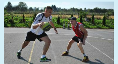
Dobrze wykonana i ustawiona proteza pozwala normalnie funkcjonować. PONAD 350 ZADOWOLENYCH PACJENTÓW ROCZNIE