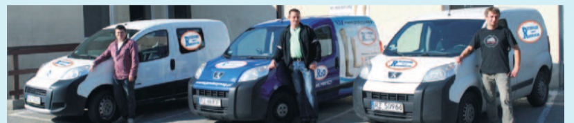
Na terenie Polski poł.-wsch. oferujemy bezpłatne konsultacje medyczne w domu pacjenta

Zadzwoń przyjedziemy do Ciebie tel. 600 957 552