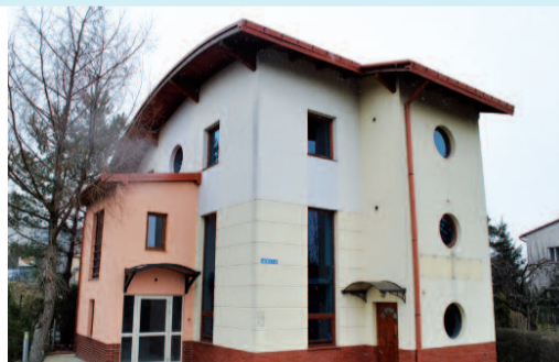
Siedziba firmy w Rzeszowie

WJAZD OD STRONY SZPITALA 10 m OD PRZYSTANKU MPK „ZADRZEWIONĄ ALEJKĄ”